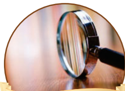
פרשת השבוע עמ' 3