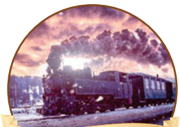
סיפור לשבת עמ' 2