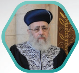
מרן הרש"ל"צ הרב יחזקאל יוסף שליט"א בכל מוצאי שבת בשעה 21:30

ערוץ הלוויין דר וסוחרת . לוויין יוטלסאט 7A. תדר 12529 .S.R. 01480 H.