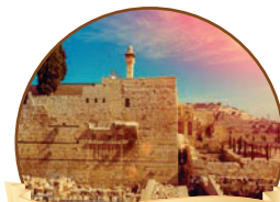
פינת ההלכה עמ' 3